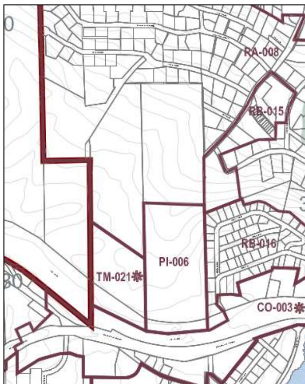
AVANT LA MODIFICATION