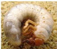
Stade larvaire Ver blanc

C'est surtout au stade larvaire que le hanneton cause des dommages. À la mi-juin, les hannetons sortent du sol et vont s'accoupler tard en soirée. Les œufs sont déposés dans le sol à une profondeur d'environ 10 cm (4 po). Les vers se nourrissent de racines de juillet à octobre. C'est en octobre que vous pourriez voir les plus gros dommages. Au printemps suivant, les vers seront à leur taille maximale et se transformeront en hanneton à la mi-juin et recommenceront le cycle.