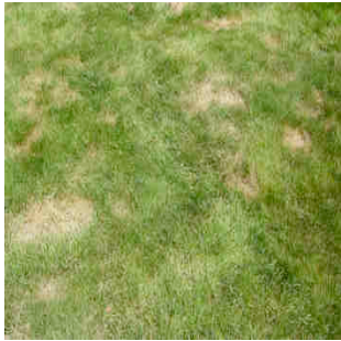
Domage à la pelouse

Elle cause un dommage en suçant la sève de l'herbe. Si des plaques jaunes apparaissent sur votre pelouse vers la fin juin, c'est que la punaise est présente en grande quantité. Contrairement aux dommages causés par le ver blanc, le gazon ne s'arrache pas facilement.