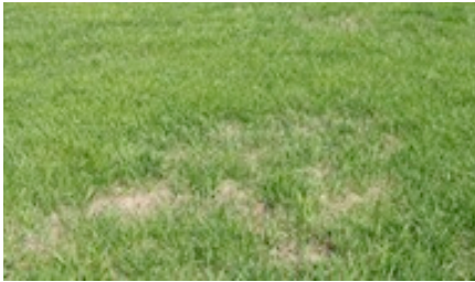
Dompage à la pelouse

Le ver blanc est en fait la larve du hanneton. Le ver se nourrit de racines de diverses plantes mais il affectionne particulièrement la pelouse. Sans ses racines le gazon meurt. Il y a alors apparition de plaques jaunes. Vu le dommage causé aux racines, la pelouse à cet endroit sera facile à arracher.