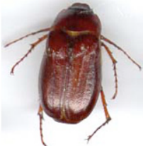
Stade adulte Hanneton

À la mi-août, la larve longue de quelques millimètres seulement, peut être repérée en soulevant la pelouse jusqu'au niveau des racines et enlevée manuellement. Considérez que votre pelouse a un problème si vous trouvez plus de 5 larves au pied carré. Le même exercice peut être fait au printemps.